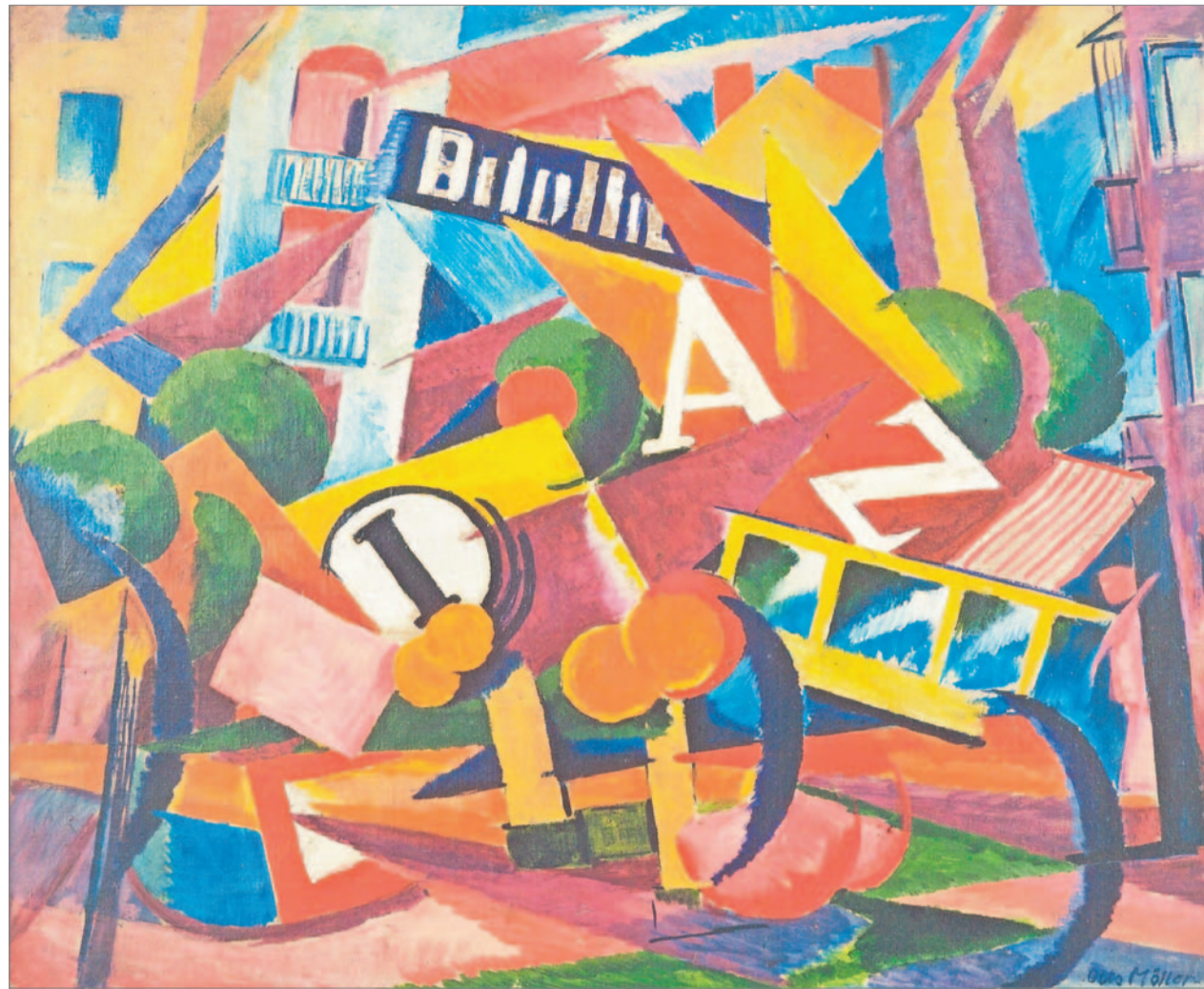
So explodierte die Kunst nach dem Ersten Weltkrieg: Das Gemälde „Strassenlärm“ aus dem Jahr 1920 von Otto Möller in der Ausstellung zur Novembergruppe in der Berlinischen Galerie. Foto: VG-Kunst / Kai-Annett Becker, epd

Mit „Die Kunst der Novembergruppe 1918 bis 1935“ feiert die Berlinische Galerie den 100. Geburtstag der nach der Novemberrevolution benannten Vereinigung. Mit 119 Werken ist es die erste umfassende museale Präsentation.