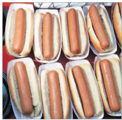
Aus der „Frankfurter“ wurde die „Liberty Sausage“.

Heines Auswahl mag willkürlich sein, immerhin aber bietet er eine bunte Mischung. Sinnvoll sind die Beispiele allemal, denn die meisten davon