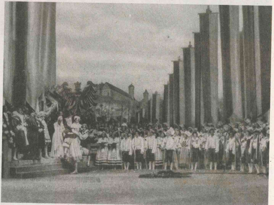
Szenenbild aus Richard Wagners Oper Die Meistersinger von Nürnberg , die 1935 im Nürnberger Opernhaus aufgeführt wurde. Das Bühnenbild stammt vom Architekten und damaligen „Reichsbühnenbildner“ Benno von Arent (1898–1956).

Propaganda und Musiktheater in Nürnberg Ausstellung im Dokumentationszentrum Reichsparteitagsgelände 15. 6. 2018 bis 3. 2. 2019